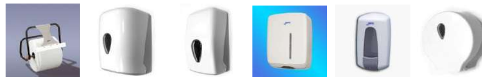
Industrial Mecha Mecha Mini Toalleta Jabón Higiénico